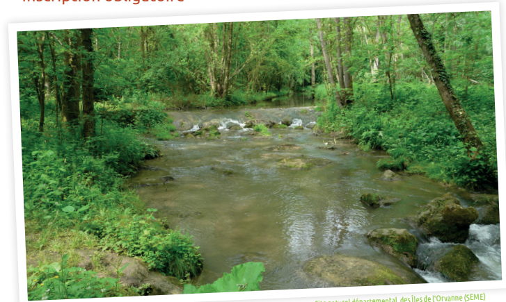
Site naturel départemental des Îles de l'Orvanne (SEME)