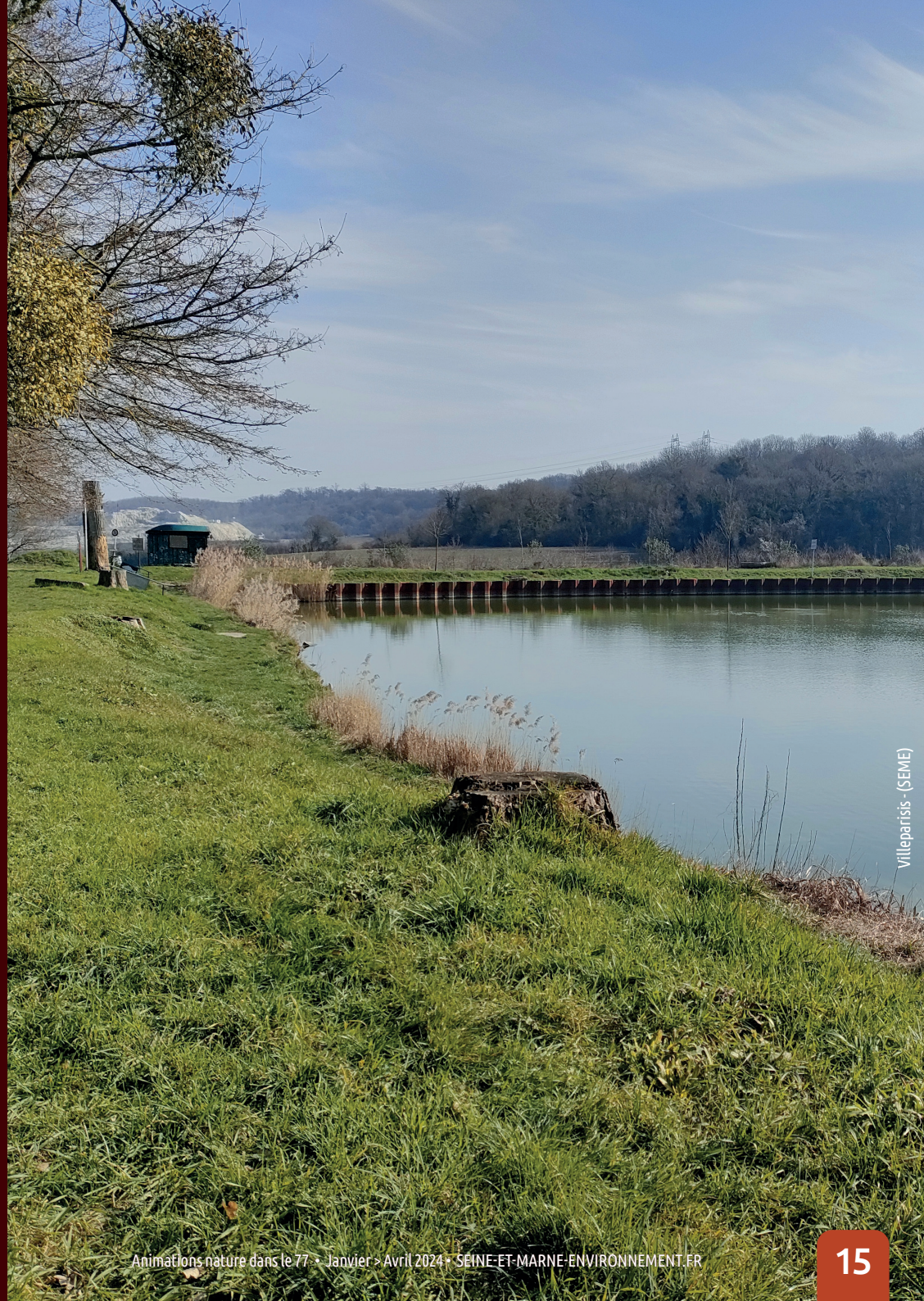
Villeparisis - (SEME)