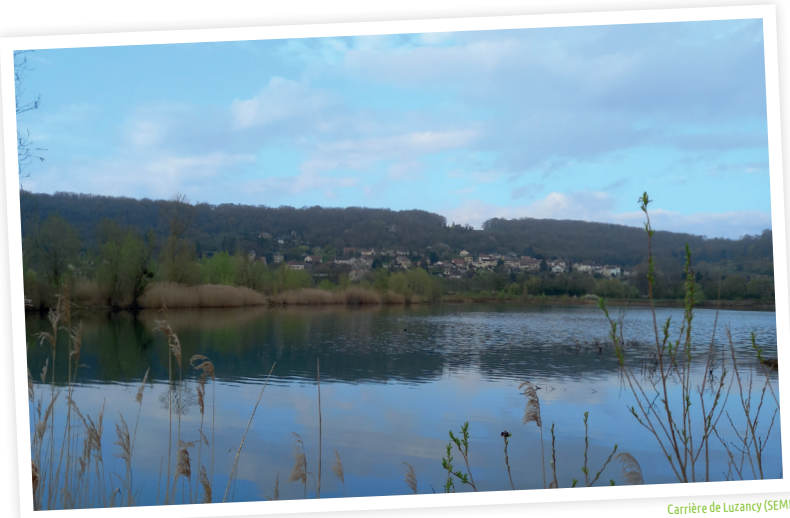
Carrière de Luzancy (SEME)