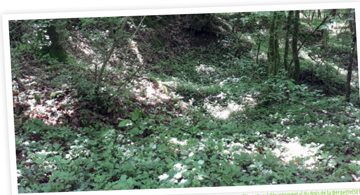
Site naturel départemental du Bois de la Bergette (SEME)