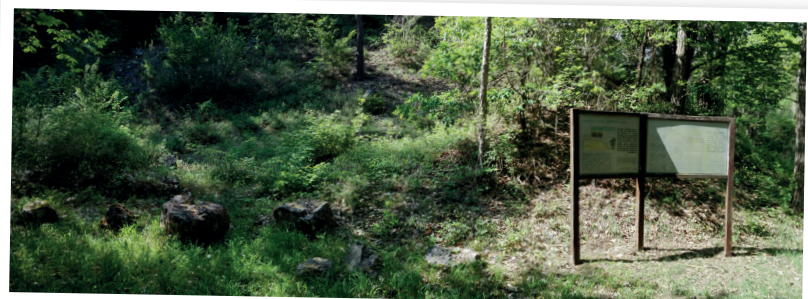
Site naturel départemental Le Bois des Palis (SEME)