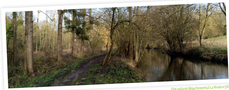
Site naturel départemental La Rivière (SEME)