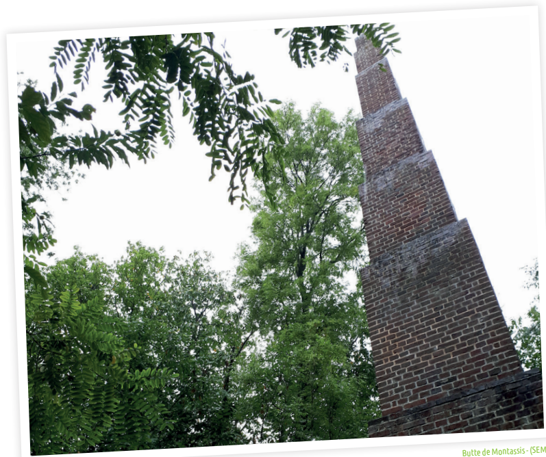
Butte de Montassis - (SEME)