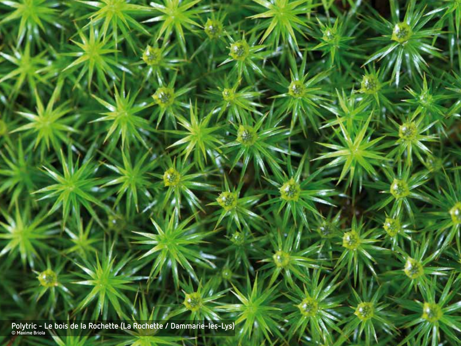
Polytrich - Le bois de la Rochette (La Rochette / Dammarie-les-Lys)