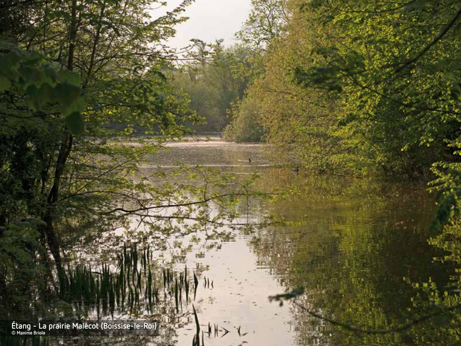
Étang - La prairie Malécot (Boissise-le-Roi)