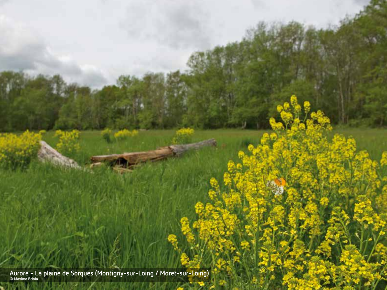
Aurore - La plaine de Sorques (Montigny-sur-Loing / Moret-sur-Loing)