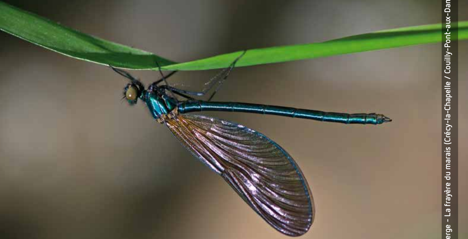
Calopteryx virge - La frayère du marais (Crécy-la-Chapelle / Couilly-Pont-aux-Dames)