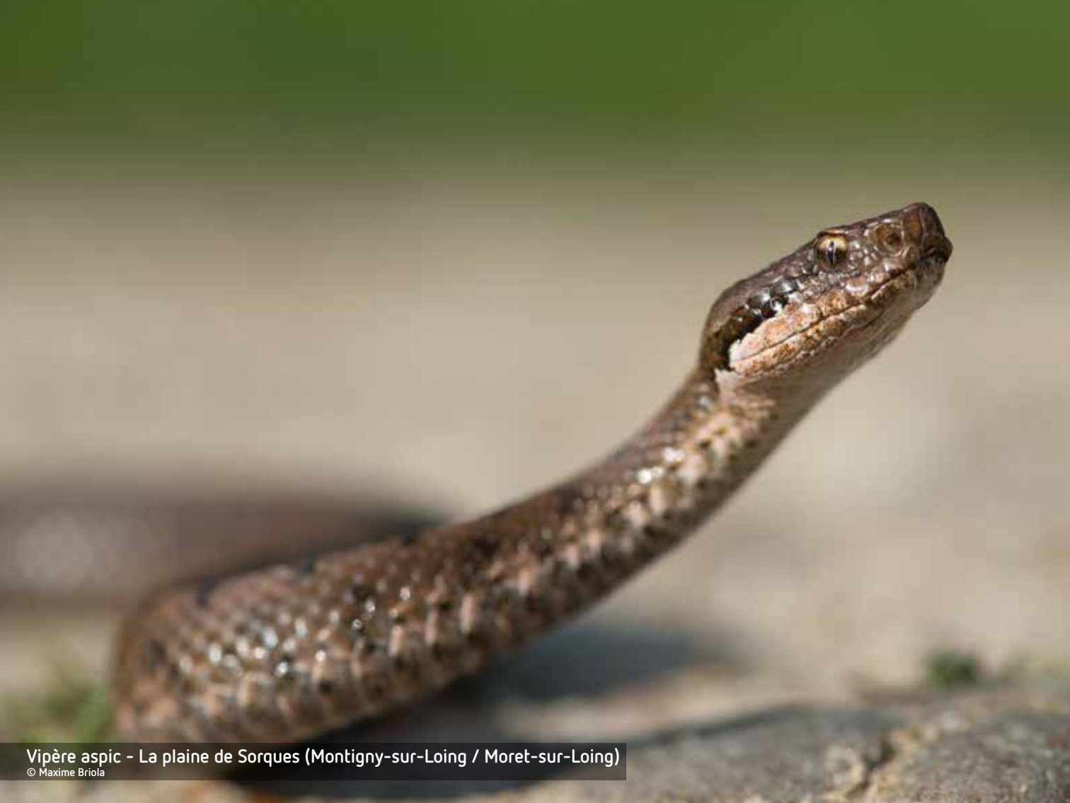
Vipère aspic - La plaine de Sorques (Montigny-sur-Loing / Moret-sur-Loing)