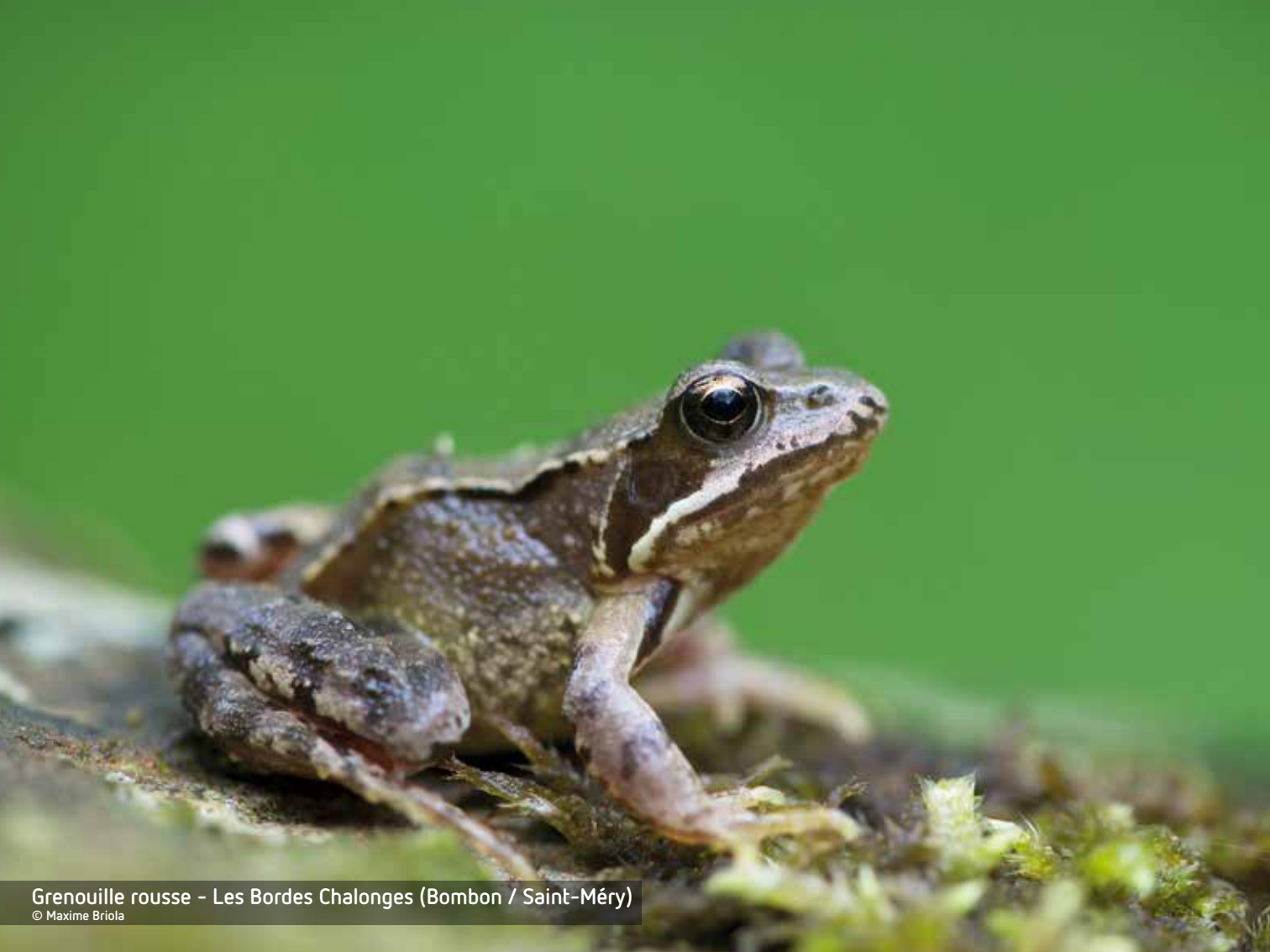
Grenouille rousse - Les Bordes Chalonges (Bombon / Saint-Méry)