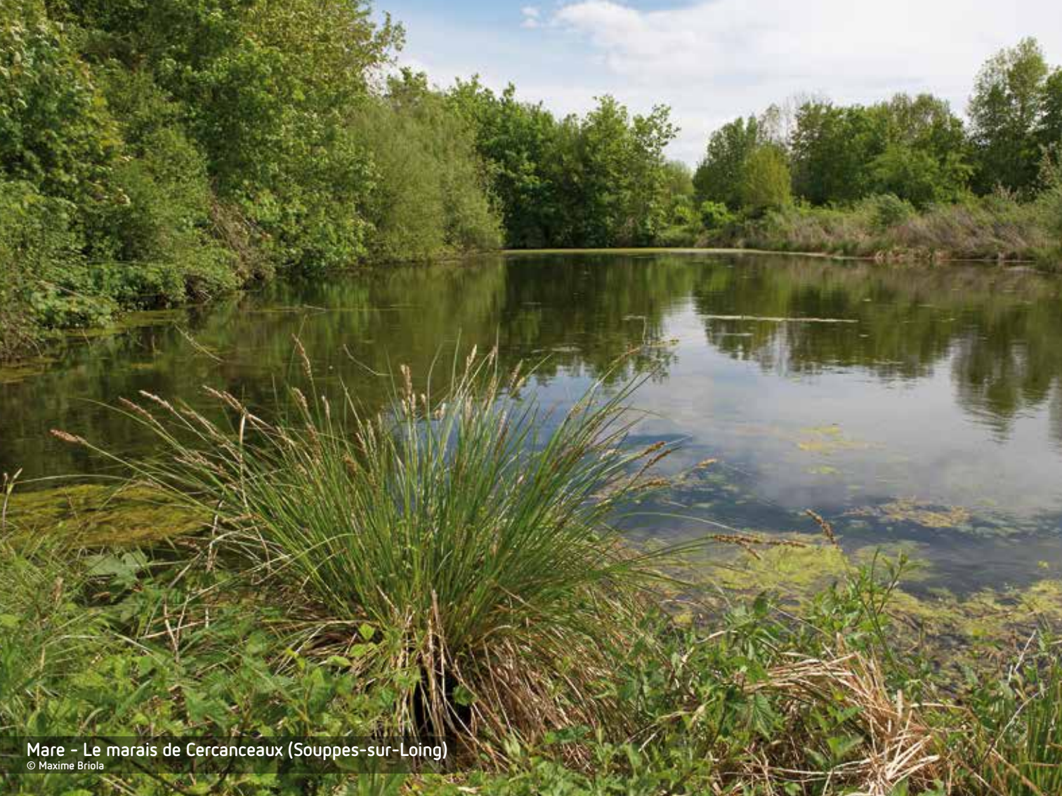
Mare - Le marais de Cercanceaux (Souppes-sur-Loing)