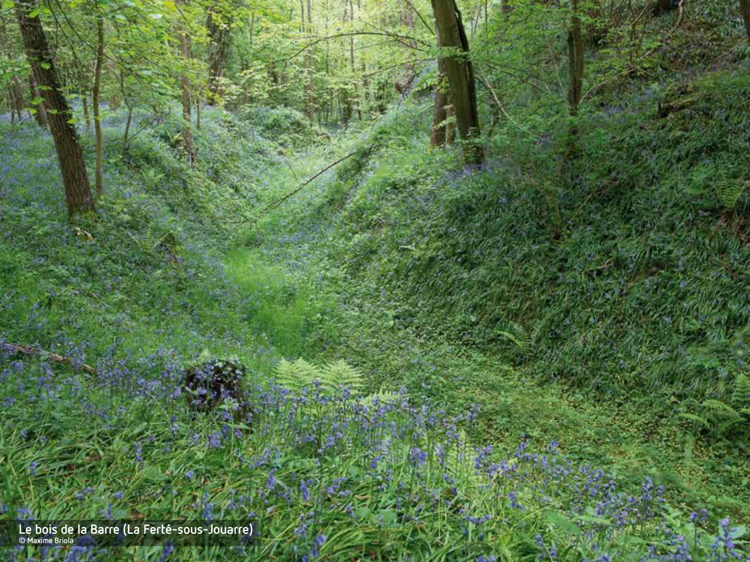
Le bois de la Barre (La Ferté-sous-Jouarre)