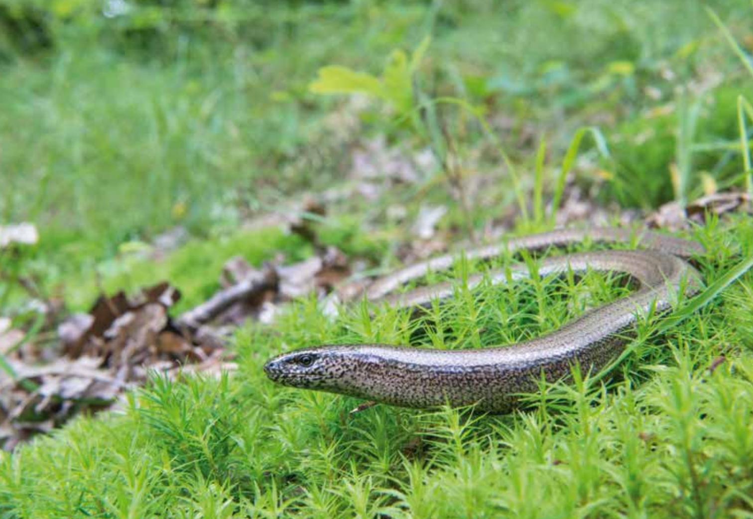
Orvet fragile - Le bois de la Rochette (La Rochette / Dammarie-les-Lys)