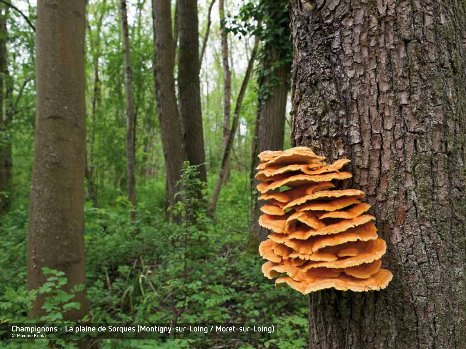
Champignons - La plaine de Sorques (Montigny-sur-Loing / Moret-sur-Loing)