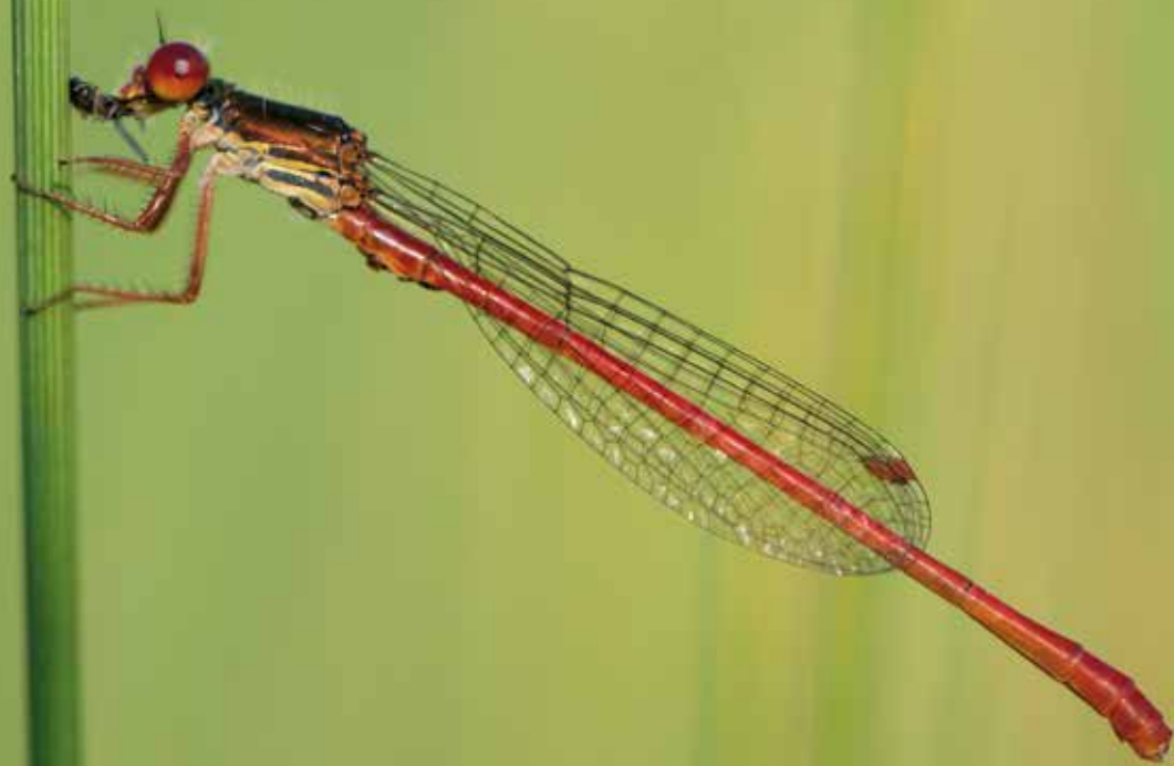
Agrion délicate - Le marais d'Épisy (Épisy)